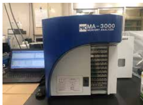
MA-3000 : 固体状