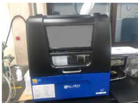
RA-4500 : 液体状